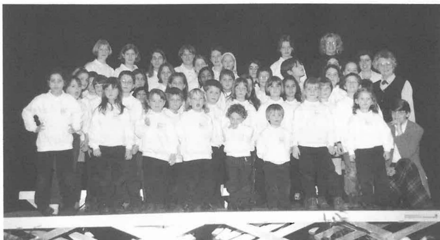
Gruppenbild der Bouneweger Nuechtigailercher, aufgenommen am 6. Februar 2000, anlässlich der Kaffisstuff im Centre Culturel